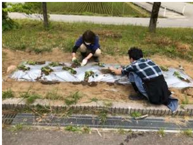
～じゃがいも植え付け～

製作を通じて自信が付き、自己肯定感を高めることが就労につながると考えています。昨年度は、6名の就労が決まりました。今後も本人の希望や適性を見極めた支援を行い、就労につながるよう頑張っていきたいです。 (担当:岩井)