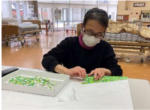
利用者共同作品（貼り絵パート）作成中です。

春の陽気に誘われて「何か新しいことに挑戦したいな」という気持ちが芽生えてきます。「思い立ったが吉日」と言いますが、行動の結果は成功が約束されたものではありません。『成功は必ずしも約束されていないが、成長は必ず約束されている』（アルベルト・ザッケローニ（元サッカー日本代表監督））失敗した時は、この言葉を励みにしています。