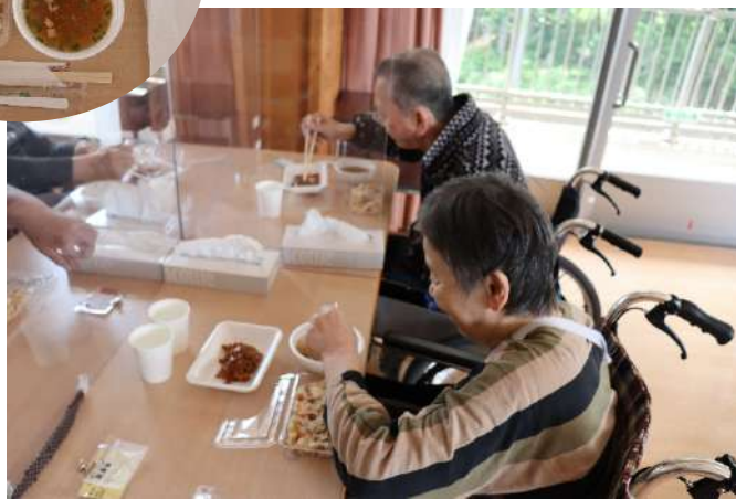
～非常食準備の様子～